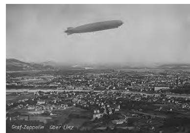
Zwischen den Kriegen, Schlossmuseum