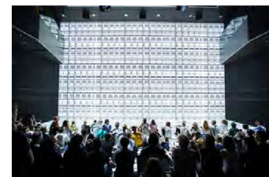
Ars Electronica