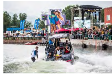
Bubble Days