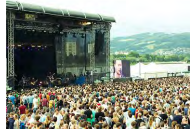
Ahoi! The Full Hit Of Summer