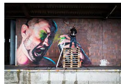
Mural Harbor SHED 2015, Paint It Black

MS Linzerin: 28. April bis 7. Oktober 2018, 3 x täglich (außer Montag), www.donauschiffahrt.eu