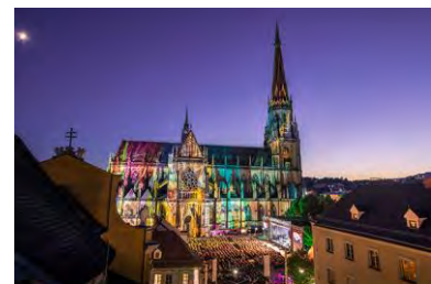
Klassik am Dom