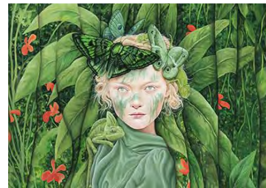
NextComic 2018 Sujet © Moki