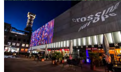
Filmfestival Crossing Europe