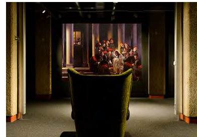
Ölhades © Schule des Ungehorsams