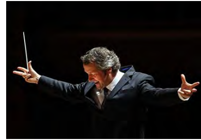
Markus Poschner

Auch das Bruckner Orchester Linz macht mit einer einschneidenden Veränderung von sich reden. Markus Poschner , der neue Chefdirigent und Opernchef im Musiktheater, will den international renommierten Klangkörper als „ Orchester zum Anfassen “ positionieren und setzt unter anderem auf neue Formate, wie die „ Kost-Proben “: Neugierige Zuhörer nehmen im Brucknerhaus eine halbe Stunde lang an einer Probe mit dem Chefdirigenten teil und genießen im Anschluss die schöne Aussicht im Brucknerhaus bei einem Mittagessen . Besonderes Augenmerk will Poschner einer neuen Sicht auf Anton Bruckner schenken und das von zahlreichen Interpretationen beladene Lebenswerk in seiner Ursprünglichkeit freilegen. Und das nicht nur für das Linzer Publikum: Gastspiele in Wien und Salzburg sowie eine Tournee durch Großbritannien sollen die musikalische Handschrift des Bruckner Orchesters verdeutlichen.