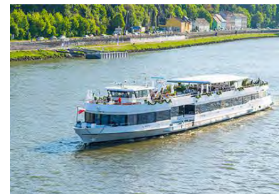
Bootstour MSLinzerin

Auf dem Rückweg passiert das Schiff den Mural Harbor . In der angesagten Outdoor-Graffiti-Galerie haben in den vergangenen Jahren Sprayer aus aller Welt über hundert farbenfrohe Kunstwerke auf den 40 Meter hohen Industriebauten hinterlassen. Der Mural Harbor kann auch in speziellen Bootstouren – inklusive Crashkurs im Graffiti-Sprayen – besucht werden.